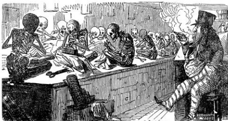
Bubbles of the Year—Cheap Clothing.

20. ( ) 上圖是諷刺漫畫家約翰·李奇的作品「便宜的衣服」(Cheap clothing)，畫面左邊是一群骷髏在縫製衣服，右邊則是穿著體面的富人。請問這張畫最有可能出現於何時？