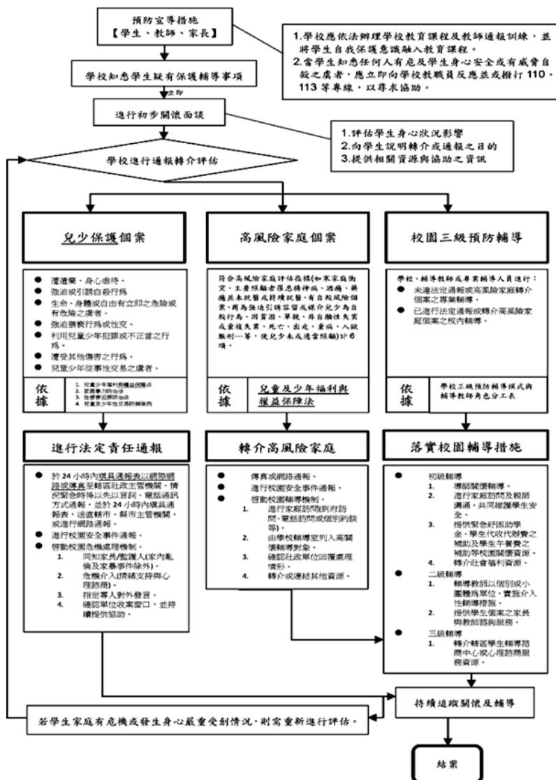
國民中小學學生保護輔導工作流程圖