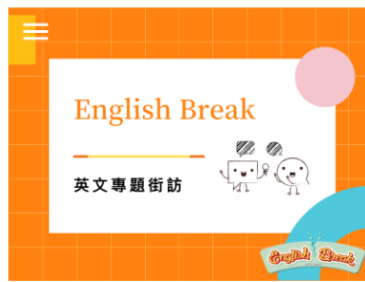
English Break 英文專題街訪