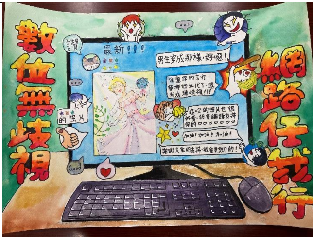
說明:110 年度性別平等教育創意海報設計競賽 ~防治數位性別暴力(國中組-特優)