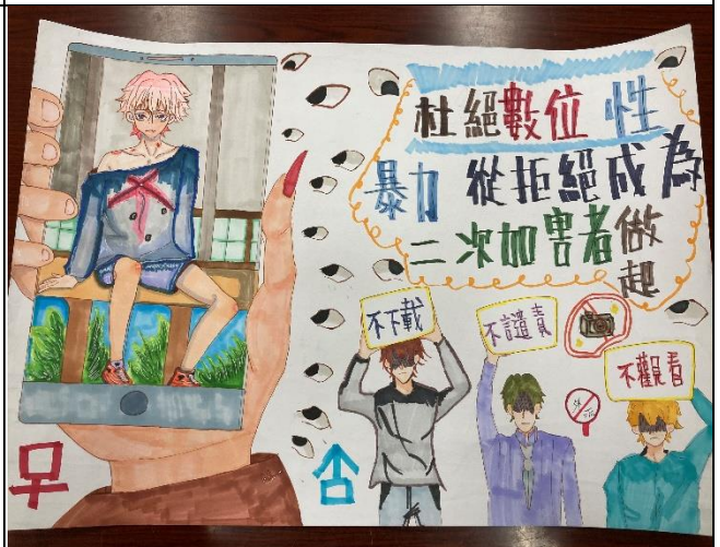
說明:110 年度性別平等教育創意海報設計競賽 ~防治數位性別暴力(國中組-優等)