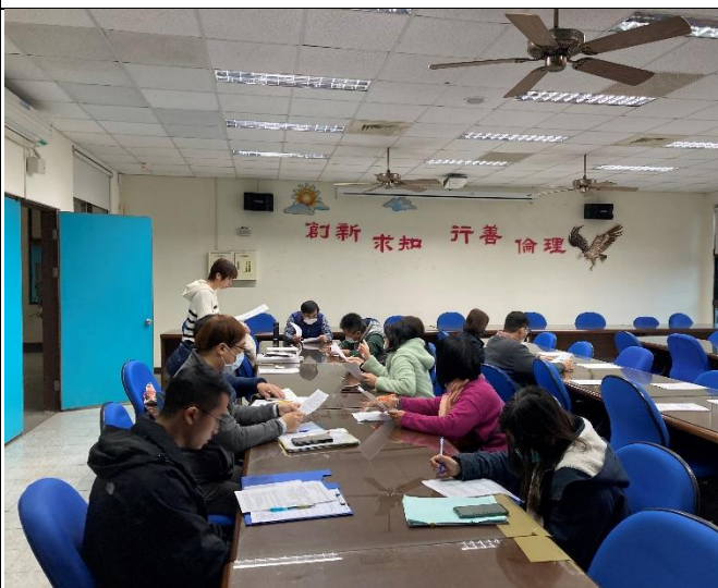
說明:109 年度第 2 學期第 2 次性平會 (110.03.22)